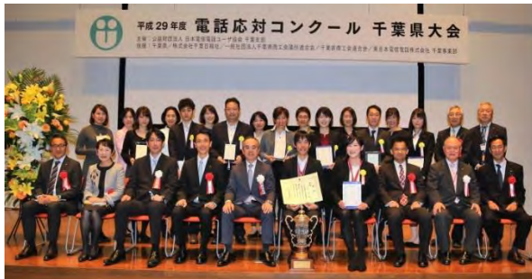
平成29年10月19日 於エム・ベイポイント幕張