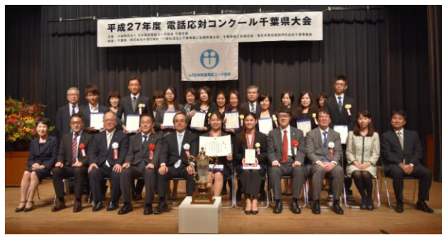
平成27年10月22日 於千葉県文化会館小ホール