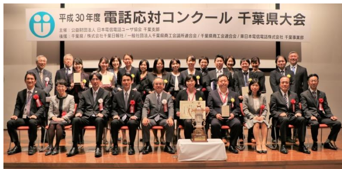
2018年10月18日 於 m BAY POINT 幕張