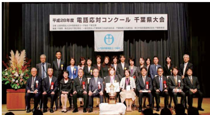
平成28年10月9日(於：千葉県文化会館)